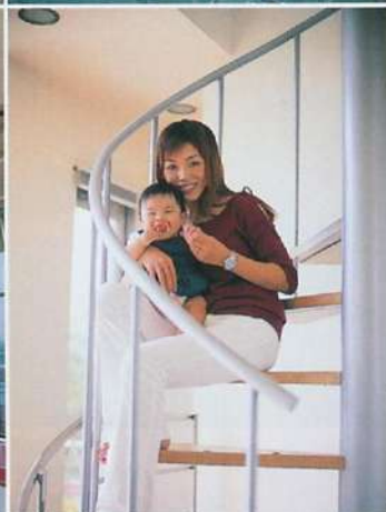
上右・硬質なイメージの浴室に緑の景観がやわらかく 上左・ガラスブロックで採光した玄関。磁器質タイルの床がクールな雰囲気 下右・奥さまと長女のくるみちゃん 下左・オリジナルデザインのらせん階段はY邸のシンボル