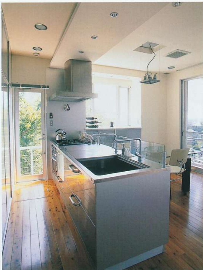
キッチン、1階全体を見渡せる対面式。「娘がまだ目を離せないで、これだけオープンだと本当に助かりますね。将来は娘にも手伝えたいので、ダイニング側からも使えるよう、カウンターはつけませんでした」（奥さま）