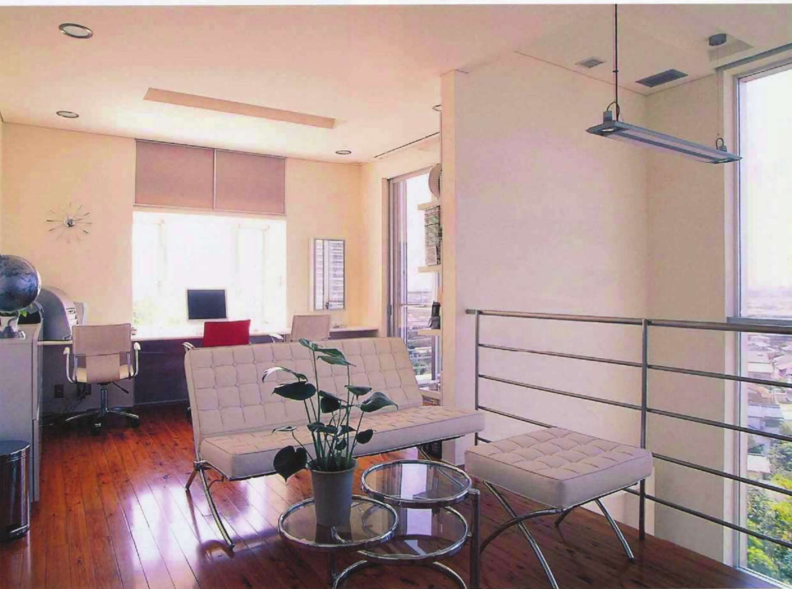
らせん階段を上がると、吹き抜けに面したホール。プライベートリビングとしても使われています。「寝る前にここで夜景を見ると落ち着くんです」と奥さま。その奥には、ご主人が自宅で仕事をするときのための書斎コーナーも設置