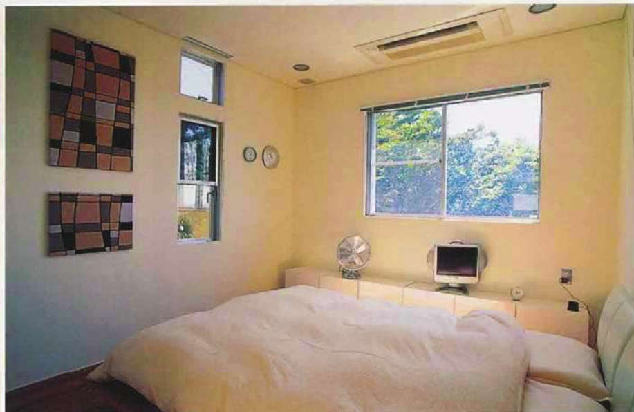
上・ホールの隣には主寝室が。開放的なホールとは対照的に静かな雰囲気。南東の窓はまるで一枚の絵のように緑の景色を切り取り、四季折々の眺めを室内にもたらししてくれます 左・4畳半の畳の間は寝室と仕切れば、将来の子供室に